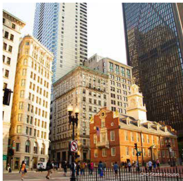
Old State House