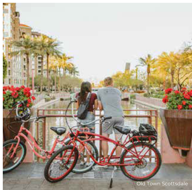
Old Town Scottsdale