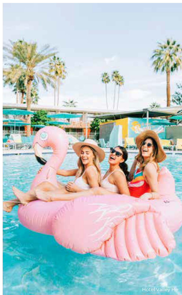
Hotel Valley Ho